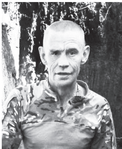
Прощание состоялось 22 января 2025 года в филиале МКДЦ ДК «Огонёк».

Земляки и односельчане скорбят вместе с вами... Вечная и светлая память нашему Герою!