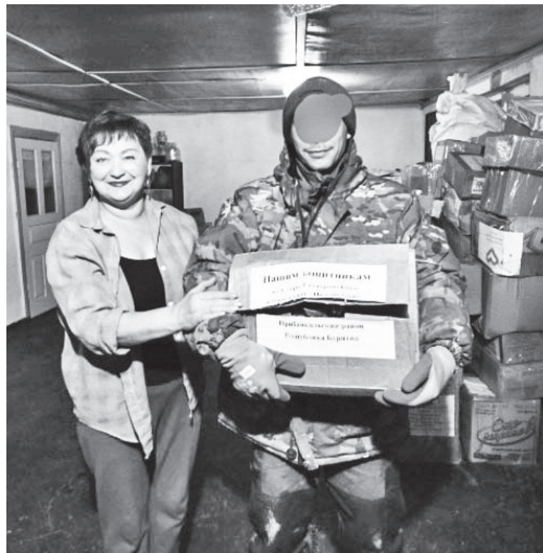
Передали подарки земляку из Прибайкальского района.