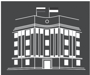
Первая сессия Народного Хурала Бурятии седьмого созыва прошла 25 сентября

Новый состав Народного Хурала Республики Бурятия собрался на свое первое пленарное заседание. По итогам состоявшихся 10 сентября выборов в законодательный орган республики избрано 66 депутатов, из них половина - «одномандатники», другая часть избрана по единому избирательному округу по партийным спискам. В целом депутатский корпус седьмого созыва обновлен почти на две трети.