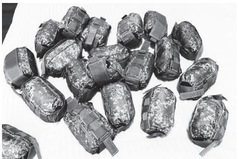
На фото: Те самые так необходимые бойцам индивидуальные аптечки, изготовленные руками волонтеров медицины Прибайкалья.